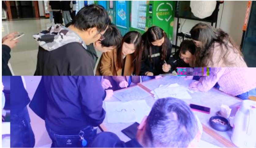
图 卓越团队建设共识营