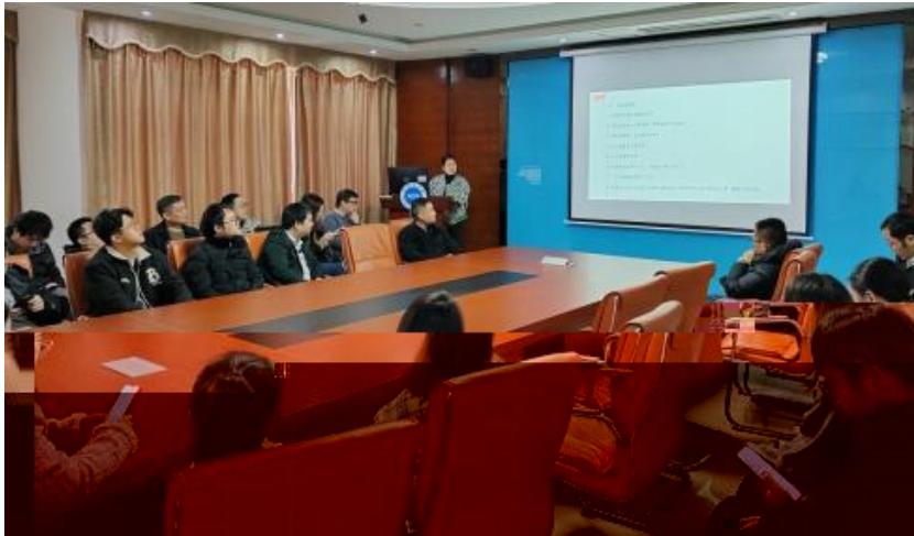
图 员工专业技能培训

，公 促 发 和 才 方 得 成 。 过 创 的 和 ， 不 动 公 的 持 成长， 工 供 的发 机会。 过 供多 化的 和发 ， “ 队 共 ” 等 活动 ( )， 帮 工 ( 技 和管 ； 并 的 和 规划， 工的 合 和 ， 包 导 发 计划、技 技 及 部 等， 地促 工的 方 发 。