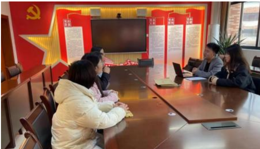
图 校企开展学术研讨项目交流会议

公 高度 队 的 ，充分 到 和 的关 ，对 高 和 关 的 。此公 供 ，包 更 、 方法 及 导 发 程，并 持 丰富 的 家 过 、 会 和 际案 ， 队 分 的 和 。 常 地 活动， 包 参加 会 、 等 ， 促 间 的 分 ， ， 并 的 队 ( )。